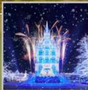
"HUIS TEN BOSCH"