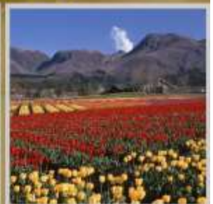
"KJUJ HANA PARK"