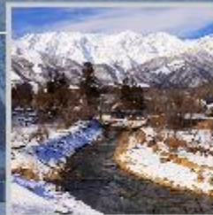
"HAKUBA OIDE PARK"