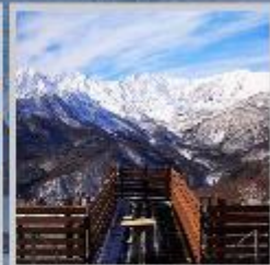
"HAKUBA MOUNTAIN HARBOR"