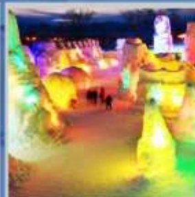
"SHIKOTSU ICE FEST"