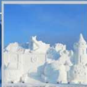
"ASAHIKAWA SNOW FEST"